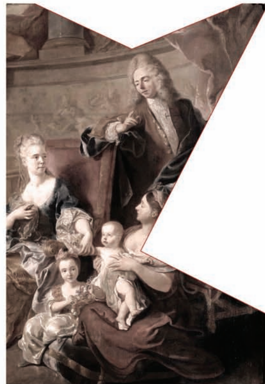
© François de Troy - La Famille de Franqueville, Musée de la Chartreuse de Douai