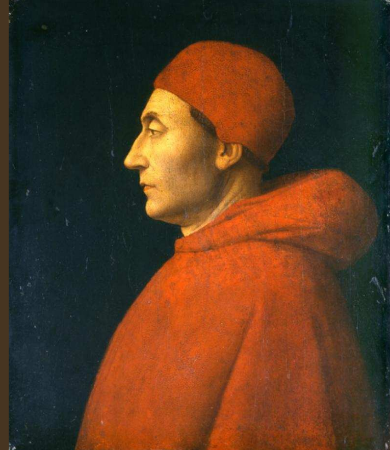
Illustration : Peintre lombard du XVe siècle, Portrait du cardinal Ascanio Sforza (?) , ca 1484-1490, Milan, Musée Poldi-Pezzoli.

Évêques et cardinaux princiers et curiaux (XIV e -début XVI e siècle) Des acteurs du pouvoir